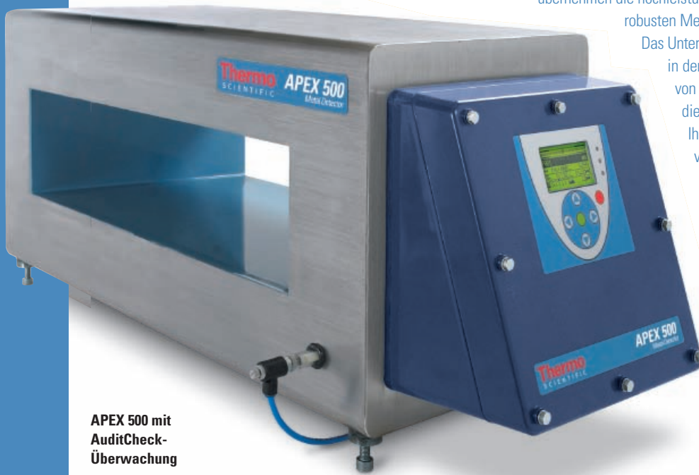
APEX 500 mit AuditCheck-Überwachung

Auf dem modernen wettbewerbsorientierten Markt müssen Lebensmittel zeitgerecht und zu einem angemessenen Preis geliefert werden. Die Qualität der Lebensmittel darf keinesfalls durch Metallverunreinigungen gefährdet werden. Dies ist ein wesentlicher Bestandteil eines HACCP-Programms. Den Schutz Ihres Produktnamens übernehmen die hochleistungsfähigen, anwenderfreundlichen und robusten Metallsuchgeräte der Modellreihe APEX 500.